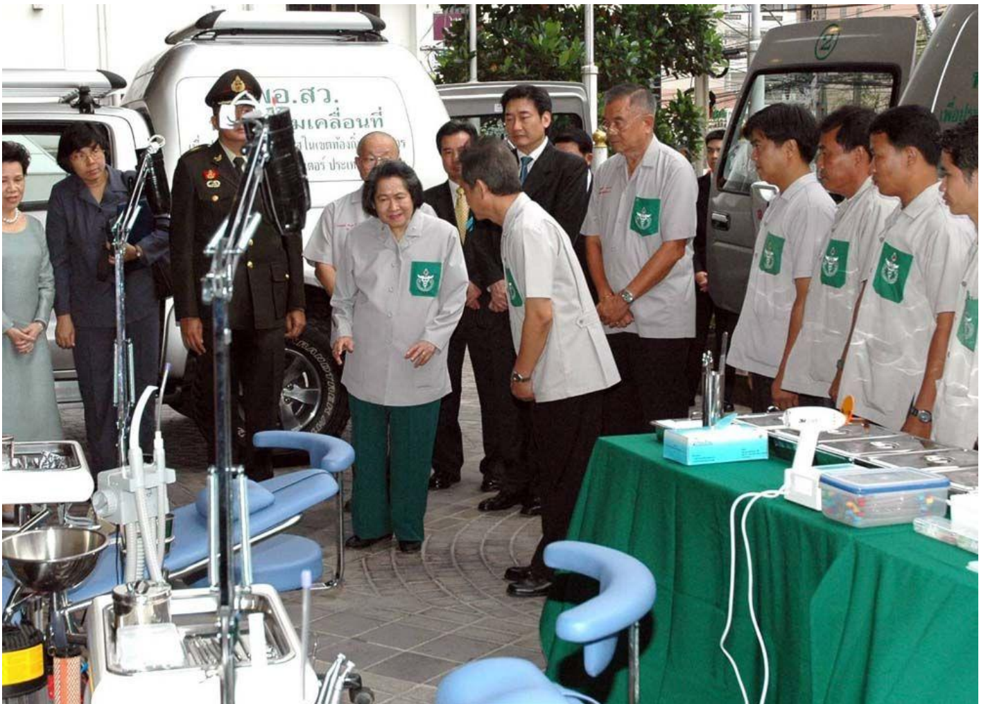
ข่าวที่เกี่ยวข้อง